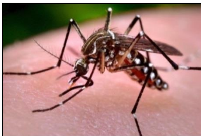
Aedes aegypti (Yellow Fever Mosquito)

Small dark mosquito with stripes, forming a harp shape on the mid-body and white banded legs. Aegypti usually approach low and behind a person, biting ankles and elbow areas.