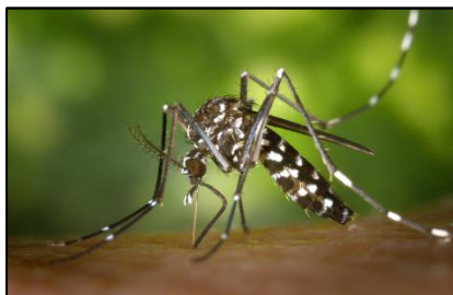
Aedes albopictus (Asian Tiger Mosquito)

Small dark mosquito with stripes, forming a harp shape on the mid-body and white banded legs. Aegypti usually approach low and behind a person, biting ankles and elbow areas.