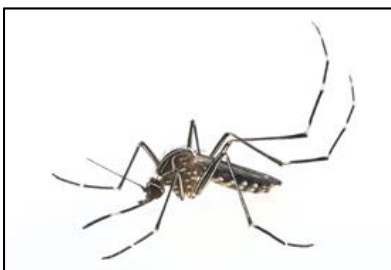
Aedes notoscriptus (Australian Backyard Mosquito)

Small black mosquito with a bright white stripe on the front of the mid-body and bright white banded legs. This mosquito is an aggressive, rapid daytime biter.